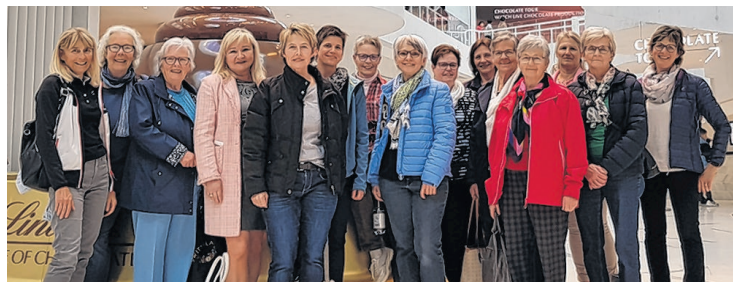
Text/Foto Frauengemeinschaft Schindellegi

Neulich besuchten einige Frauen der Frauengemeinschaft Schindellegi die Lindt & Sprüngli in Kilchberg. Bei der interessanten Führung durch die Kakaopflanzung erfuhren wir von der Verarbeitung bis hin zum Kakaogetränk, über den Transport per Schiff in die weite Welt bis nach Europa und in die Schweiz, wie aus bitterem Kakao feine Schokolade entsteht. Durchschnittlich isst ein Schweizer 11 Kilo Schokolade pro Jahr. Bevor es nach den vielen süssen Versuchungen nach Hause ging, liessen wir den Nachmittag im Restaurant bei Kaffee oder Tee ausklingen.