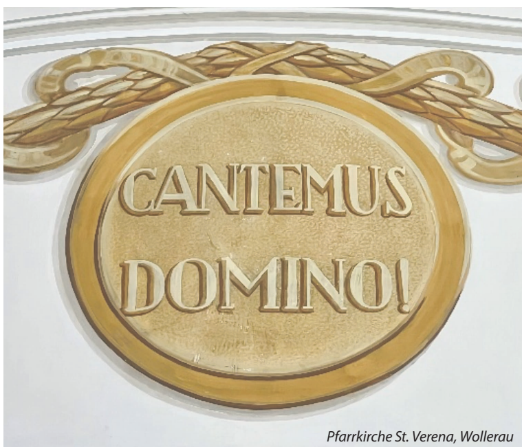
Pfarrkirche St. Verena, Wollerau

Wer singt, betet doppelt. Diese Wertschätzung des Gesangs aus dem Volksmund kommt auch im Gebetsleben und der Liturgie in unterschiedlicher Weise zum Tragen, besonders im Gesang des Halleluja.