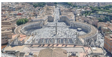
Petersplatz in Rom

Am 13. Mai machten sich über Christi Himmelfahrt 30 Ministranten zusammen mit ihren Begleitpersonen und Eltern auf den Weg in die Heilige Stadt, um sich auf die Spuren der beiden hl. Apostel Petrus und Paulus zu begeben. Unsere Jugendlichen konnten die lebendige Gemeinschaft der Römischen Kirche erleben. Nach vielen schönen Erfahrungen und einem tiefen Gefühl von Gemeinschaft konnten wir nach dem Apostolischen Segen des 266. Nachfolgers Petri die Rückreise in die schöne Schweiz antreten. «Du bist Petrus und auf diesen Felsen werde ich meine Kirche bauen und die Pforten der Unterwelt werden sie nicht überwältigen.» (Mt 16,18) Dániel László