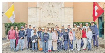
Unsere Minis bei der Schweizergarde in Rom