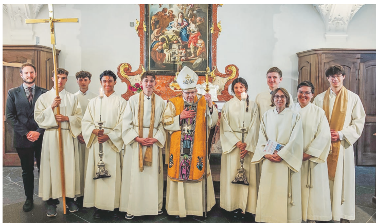
Minis Wollerau und Schindellegi

Am Dreifaltigkeitssonntag an der diesjährigen «Kirche in Not»-Wallfahrt war Kurt Kardinal Koch beim Pontifikalamt in der Klosterkirche in Einsiedeln der Hauptzelebrant. Mit dabei waren auch sechs Ministranten vom Seelsorgeraum Berg aus Schindellegi und Wollerau. Am Nachmittag fand im Kultur- und Kongresszentrum «Zwei Raben» in Einsiedeln ein Podiumsgespräch zum Thema «Kirche im Spannungsfeld von Krieg, Verfolgung, Hilfe und Diplomatie» statt.