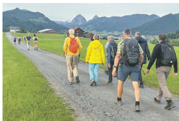
Unterwegs nach Einsiedeln