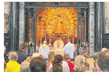
Gottesdienst in der Gnadenkapelle