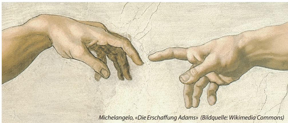
Michelangelo, «Die Erschaffung Adams»